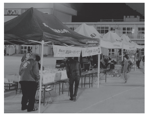
▶ ドライブイン方式でポップコーンなどを提供

症の影響もあり、一時は2020年度全ての対外的な事業の実施を断念せざるを得ない状況でした。 そのような状況でしたが、コロナ禍でも行える安全な企画として本事業の計画を行い実施に至りました。 事業終了後に参加した子供たちが笑顔で「ありがと」といながら窓を開け手を振って帰る姿を見て、当たり前が当たり前ではなくなった状況であったも、特別な体験を通じて家族との思い出を作ったことに、喜びを感じる事が出来ました。 青年会議所活動は明るい豊かなまちづくりが目的ですが、それは我々だけではなく地域の方々の支えや応援があつてこそ実現可能である事を本事業を通じて再確認する事が出来ました。